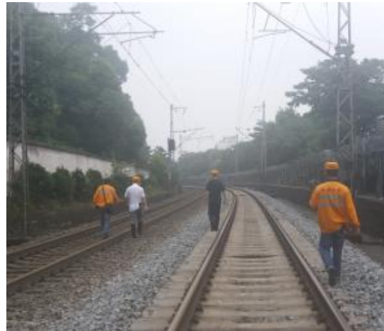
图 6 会同武汉铁路局对山北山体围墙进行排查