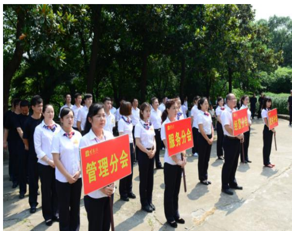
图 1 消防预案演练前的队员

安全生产没有终点，黄鹤楼公园将持之以恒抓好安全生产工作，构建安全生产长效机制，不断提高职工安全生产意识和技能，提升公园应对突发事件的能力，全力打造平安黄鹤楼形象。