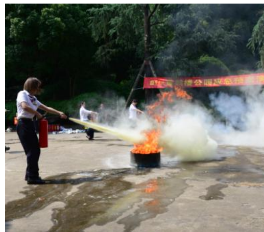
图 2 消防演练竞赛中使用灭火器灭火