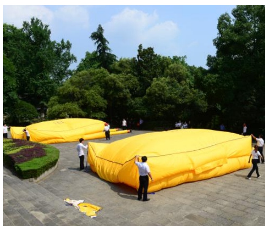
图 3 消防演练竞赛中为消防气垫充气