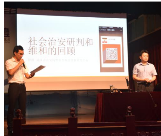
图 8 开展安全知识讲座