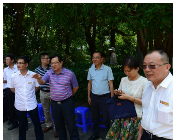
图 4 市旅游局领导对演练作指导