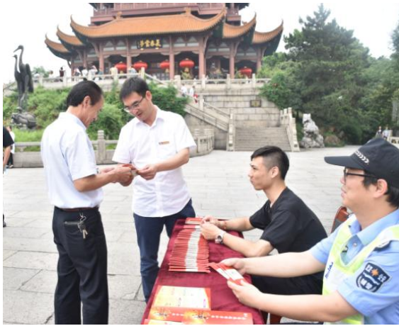
图 5 在公园西区广场设置安全生产咨询点